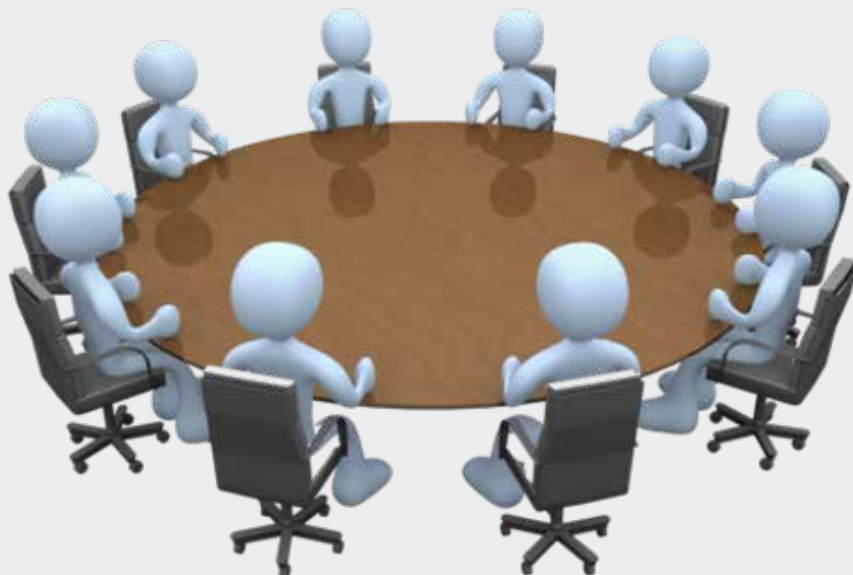
Siulersuisoqatigiit, suleqatigiissitat sammisamilu eqimattat suliniummi peqataapput