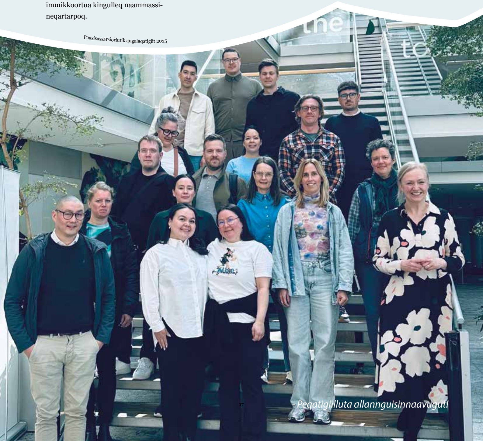
Paasisassarsiorlutik angalaqatigiit 2025

CSR Greenlandip allattoqarfia 2025-mi CBS-ip aasaanerani Ilinniarfiani peqataavoq, tassanilu ulluni tallimani ESG aamma puijuartitsineq sammeneqarput. Atuarneq soqutiginarlunilu pissarsiaqarfiulluatoq peqataaffigineqarpoq.